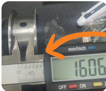
MEDIDA INTERNA BRONZINA SINTECH