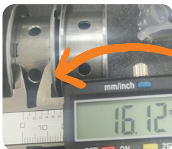
OUTRAS MEDIDAS ENCONTRADAS NO MERCADO

Caso haja dúvidas, entre em contato pelos e-mails: